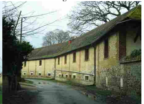
Des édifices associant briques et moellons