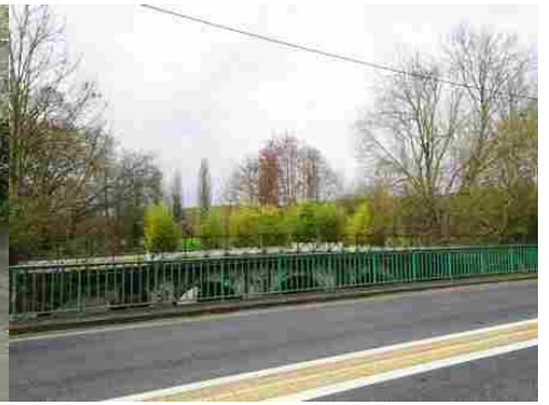
Le pont des Planches vu du pont neuf