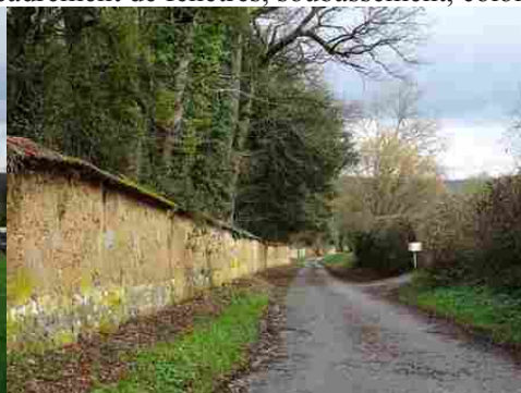
Le mur en bauge du parc du château