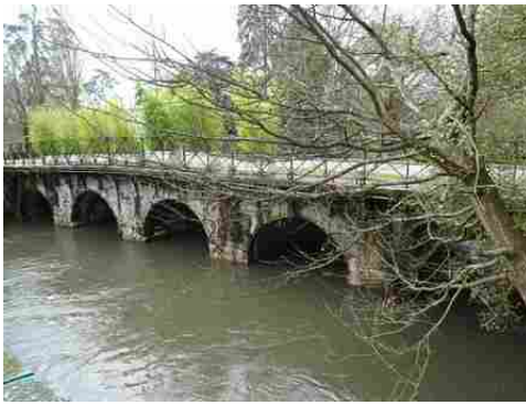
Le pont des Planches vu de la berge