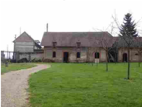
Des exemples d'architecture rurale