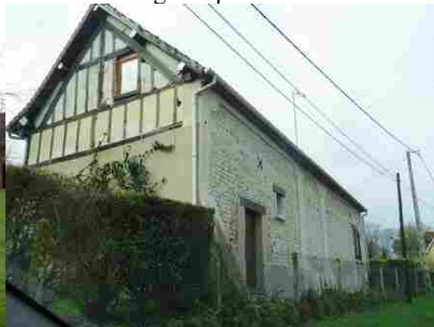
Une maison avec moellons et pans de bois