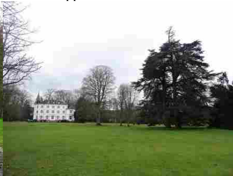
La vue vers le château des Planches

Pour la zone en rose foncé dans le périmètre de 500m