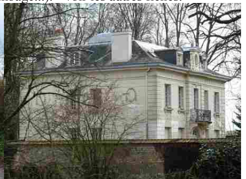
Une demeure bourgeoise