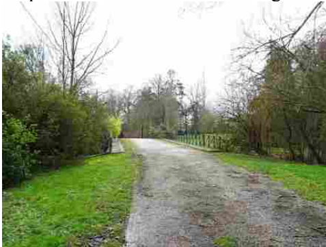
La chaussée du pont

Pour la zone en rose foncé dans le périmètre de 500m