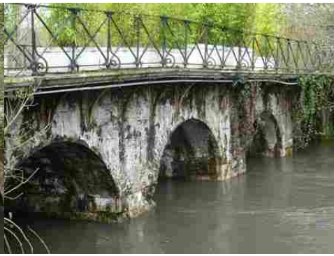
Une vue rapprochée des arches