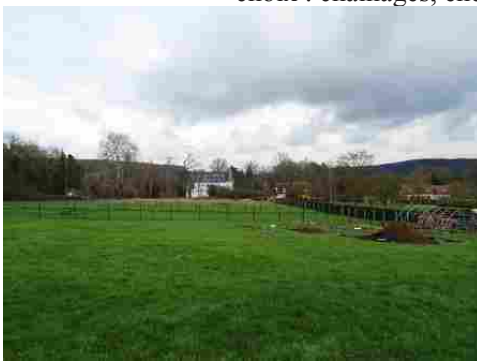
Le château vu des prairies au Sud

Les avis seront cohérents avec ceux émis ces dernières années, à savoir : pas de maisons à volume compliqué (type V, W, Y, ou Z), pentes à 45° pour les volumes principaux, ardoise ou tuile plate de teinte brun vieilli, à 20u/m², avec un débord de toiture de 20cm, enduit de teinte beige clair avec modénatures (au choix : chaînages, encadrement de fenêtres, soubassement, colombage...). *Voir les autres fiches.