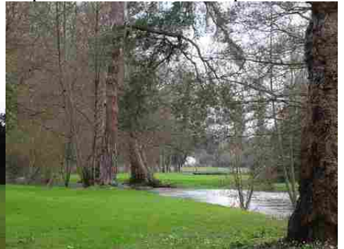
Les berges de l'Iton

Il est préférable d'éviter les constructions qui viendraient au dessus de la ligne de paysage existante (maison à deux niveaux, bâtiments agricoles de type silo, château d'eau, éolienne...). Les projets éoliens ne doivent pas se trouver dans l'axe majeur du château à moins de nuire irrémédiablement à son caractère.