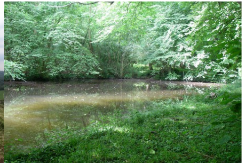
Les berges de l'Epte