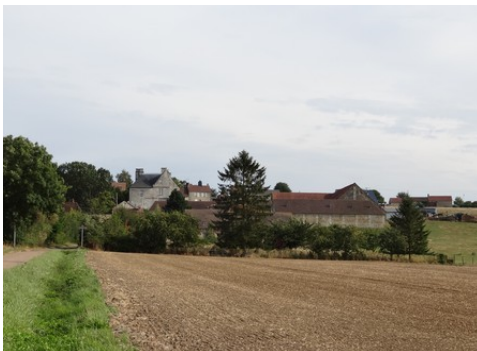
Le village et le manoir vus du Nord-Ouest

Les avis seront cohérents avec ceux émis ces dernières années, à savoir : pas de maisons à volume compliqué (type V, W, Y, ou Z), pentes à 45° pour les volumes principaux, ardoise ou tuile plate de teinte brun vieilli, à 20u/m 2 , avec un débord de toiture de 20cm, enduit de teinte beige clair avec modénatures (au choix : chaînages, encadrement de fenêtres, soubassement, colombage...). *Voir les autres fiches.