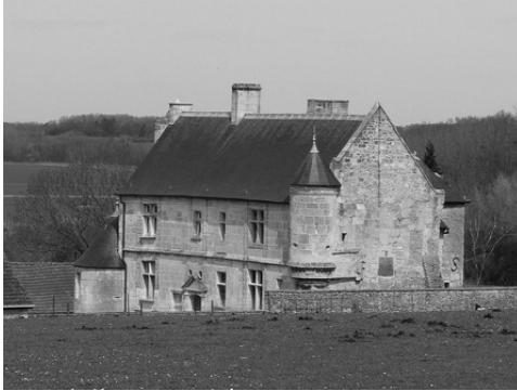
Le manoir vu depuis l'Ouest