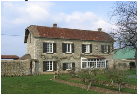
Un exemple de maison (moellons, tuiles)