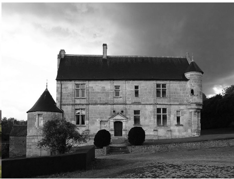
La façade sud-ouest du manoir