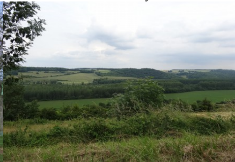
Le paysage autour de la vallée de l'Epte