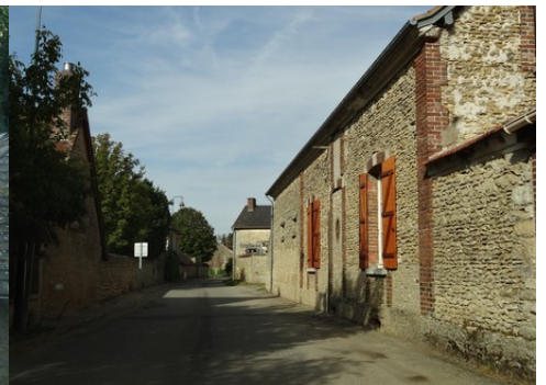
Le bâti rural avoisinant