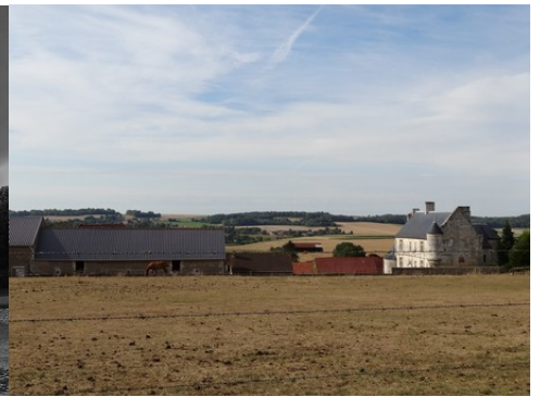
La vue vers l'Ouest avec le manoir