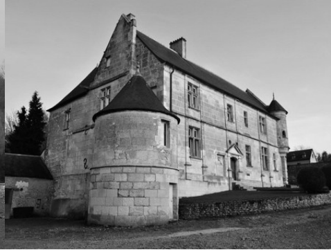
La tour basse à l'angle nord-est