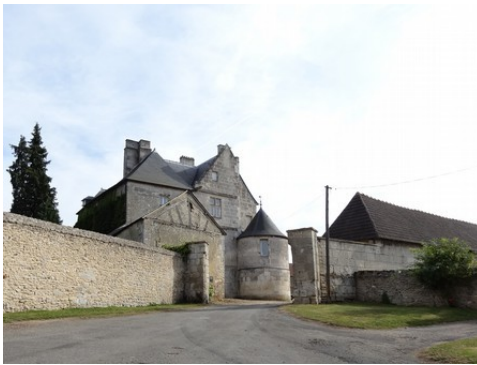
Le portail d'entrée du manoir