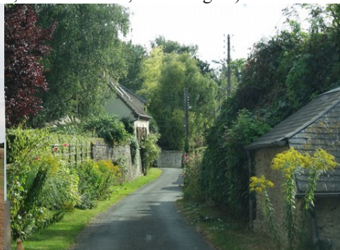
Une rue de Bus-Saint-Rémy