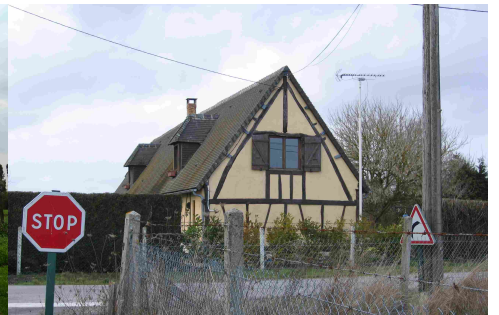
Une maison aux abords