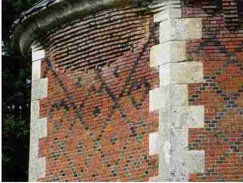
Le colombier (détail)