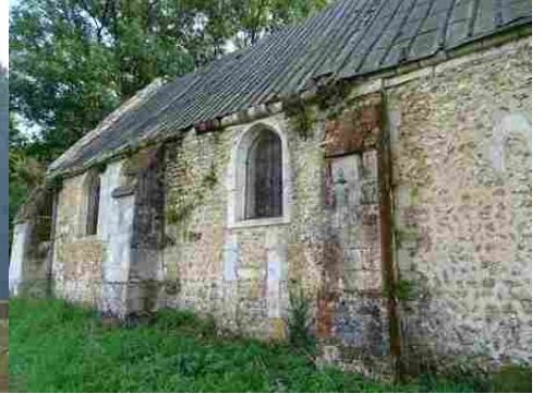
La chapelle Saint-Léger (détail)

Pour la zone en rose foncé dans le périmètre de 500m