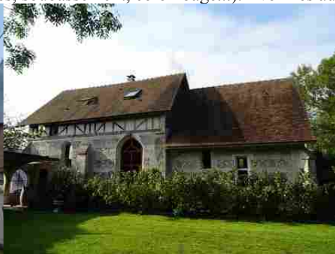
L'église de la Huanière