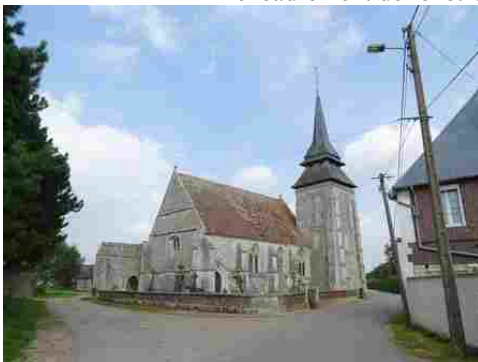
L'église du Plessis Saint-Opportune (MH)

Les avis seront cohérents avec ceux émis ces dernières années, à savoir : pas de maisons à volume compliqué (type V, W, Y, ou Z), pentes à 45° pour les volumes principaux, ardoise ou tuile plate de teinte brun vieilli, à 20u/m 2 , avec un débord de toiture de 20cm, enduit de teinte beige clair avec modénatures (au choix : chaînages, encadrement de fenêtres, soubassement, colombage...). *Voir les autres fiches.