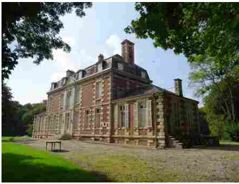
La façade sud du château