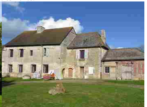
Le bâti rural avoisinant