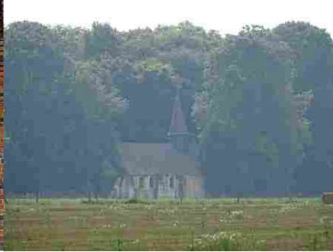
La chapelle Saint-Léger (vue lointaine)