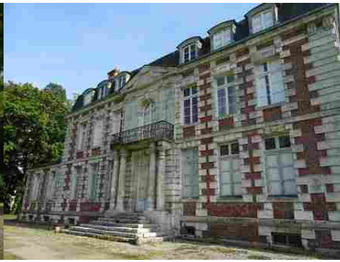
La façade nord du château