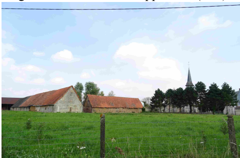
Une ferme du village