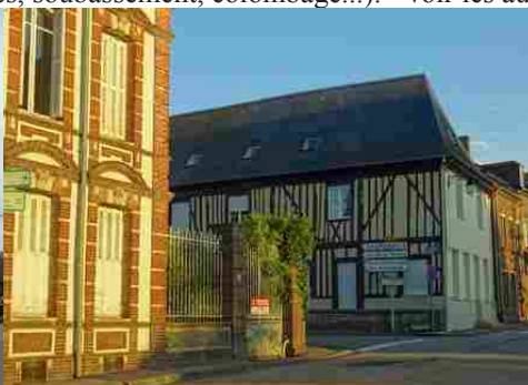
Des édifices avec briques ou pans de bois