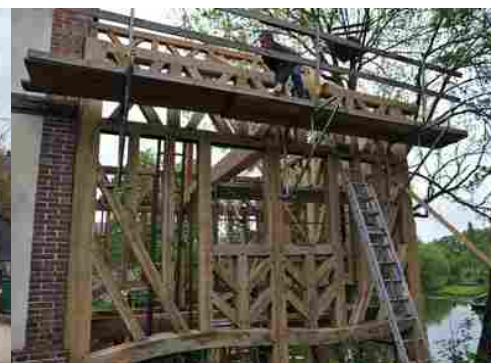
Un exemple d'extension à colombage