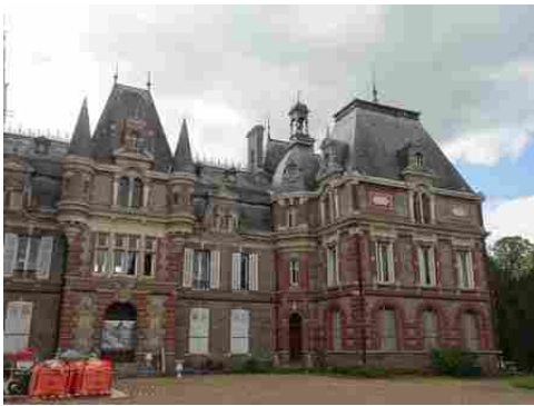
La façade Est du château