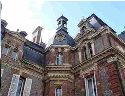
Un détail de la façade