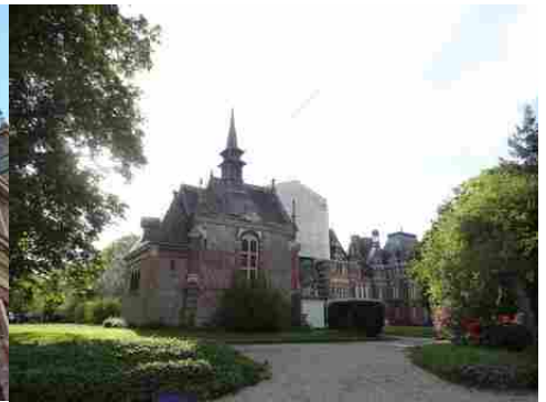
La façade principale