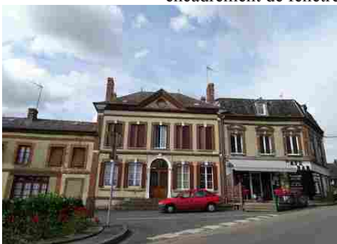
Le bâti rural alentour

Les avis seront cohérents avec ceux émis ces dernières années, à savoir : pas de maisons à volume compliqué (type V, W, Y, ou Z), pentes à 45° pour les volumes principaux, ardoise ou tuile plate de teinte brun vieilli, à 20u/m 2 , avec un débord de toiture de 20cm, enduit de teinte beige clair avec modénatures (au choix : chaînages, encadrement de fenêtres, soubassement, colombage...). *Voir les autres fiches.