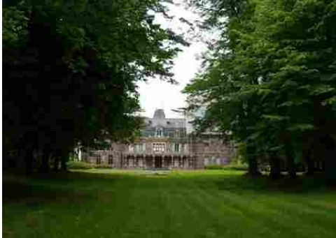
La façade Ouest vue depuis le parc