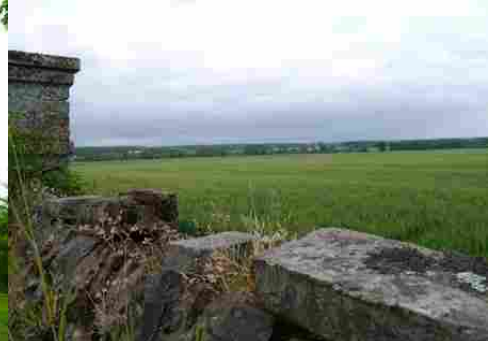
La vue sur les champs alentours