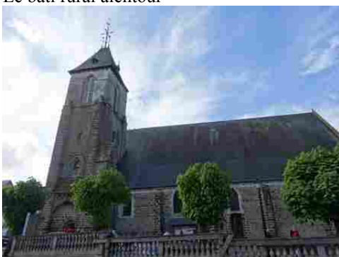
L'église de la Neuve Lyre