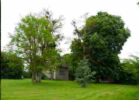
La chapelle vue depuis le parc