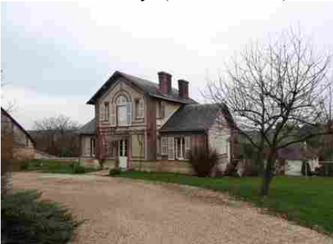
Le bâti rural avoisinant