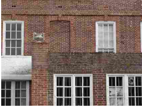
La brique en façade (détail)