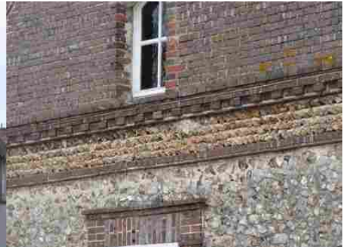
La combinaison des matériaux (détail)