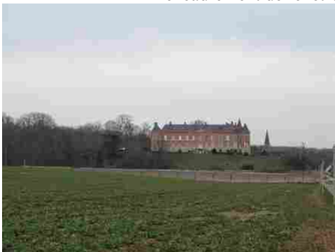
Le château de Louye (voir autre fiche)

Les avis seront cohérents avec ceux émis ces dernières années, à savoir : pas de maisons à volume compliqué (type V, W, Y, ou Z), pentes à 45° pour les volumes principaux, ardoise ou tuile plate de teinte brun vieilli, à 20u/m 2 , avec un débord de toiture de 20cm, enduit de teinte beige clair avec modénatures (au choix : chaînages, encadrement de fenêtres, soubassement, colombage...). *Voir les autres fiches.