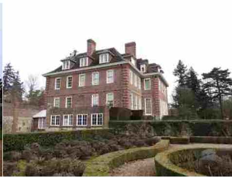
La façade sud depuis le parc