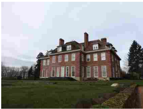
La façade est du château