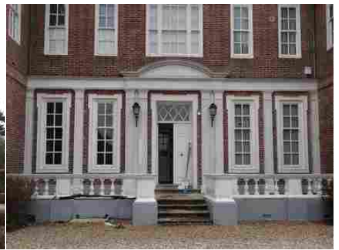
L'entrée et son perron