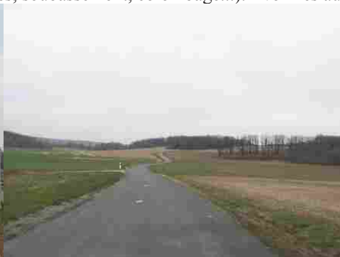
L'alternance de plaines et de bois