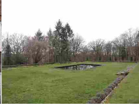
Le parc et les bois alentours