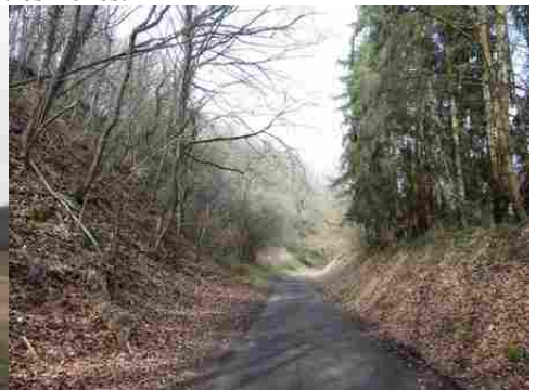
Une route voisine traversant un bois