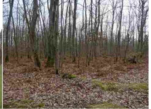
Les bois entourant le château

Pour les zones en bleu dans le périmètre de 500m et au-delà