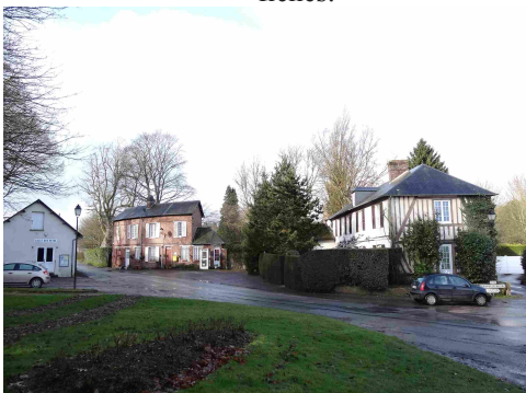
Le village de Drucourt

Les avis seront cohérents avec ceux émis ces dernières années, à savoir : pas de maisons à volume compliqué (type V, W, Y, ou Z), Rez-de-chaussée + Combles, pentes à 45° pour les volumes principaux, ardoise ou tuile plate de teinte brun vieilli, à 20u/m², avec un débord de toiture de 20cm, enduit de teinte beige clair avec modénatures (au choix : chaînages, encadrement de fenêtres, soubassement, colombage...). *Voir les autres fiches.