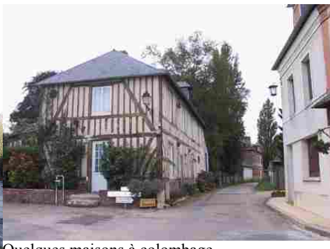
Quelques maisons à colombage