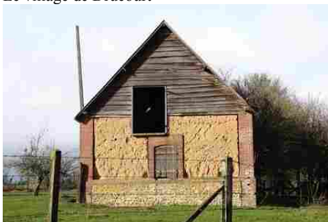
Un exemple d'architecture rurale