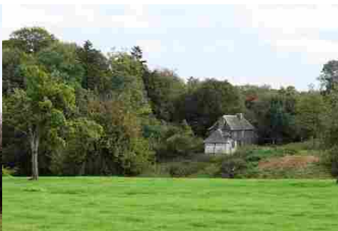
La campagne environnante