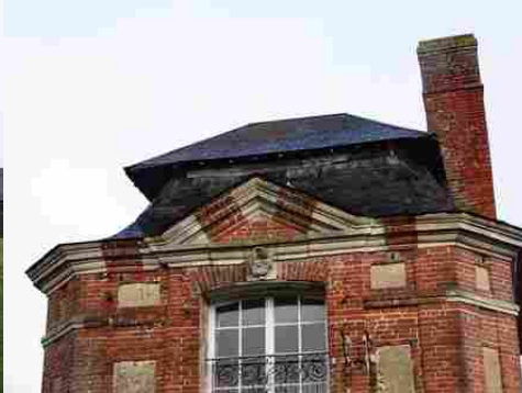
Le détail d'un fronton (aile est)