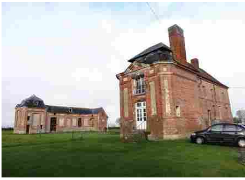
Les deux ailes et leurs pavillons