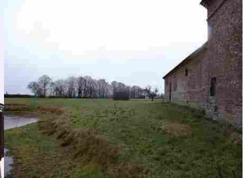
La prairie avec une mare

Pour la zone en rose foncé dans le périmètre de 500m