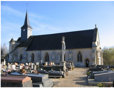
L'église paroissiale depuis le cimetière