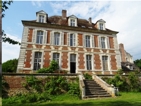
L'aile sud en brique et pierre de taille