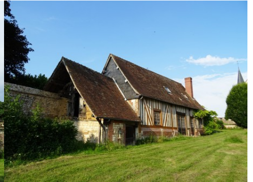
Une dépendance intégrée à la clôture

Pour la zone en rose foncé dans le périmètre de 500m