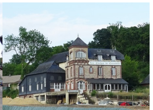
L'auberge de Cloches de Corneville