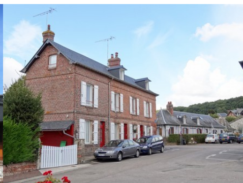
Une maison en briques