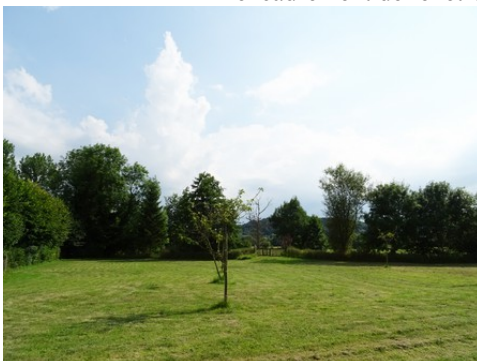
La vue vers la Risle, au Sud

Les avis seront cohérents avec ceux émis ces dernières années, à savoir : pas de maisons à volume compliqué (type V, W, Y, ou Z), pentes à 45° pour les volumes principaux, ardoise ou tuile plate de teinte brun vieilli, à 20u/m², avec un débord de toiture de 20cm, enduit de teinte beige clair avec modénatures (au choix : chaînages, encadrement de fenêtres, soubassement, colombage...). *Voir les autres fiches.