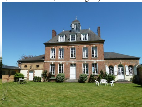
Une belle architecture de briques