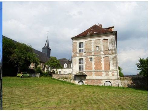
L'aile sud du cloître et l'église