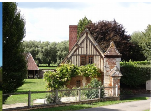
Une maison à pans de bois