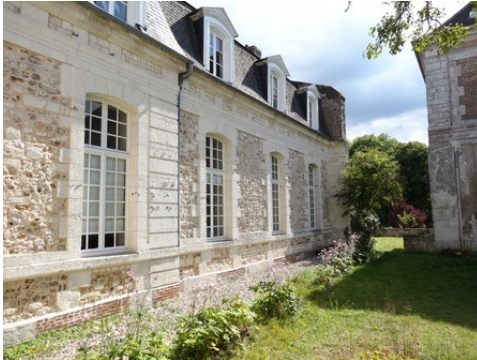
L'aile est autour bordant le cloître