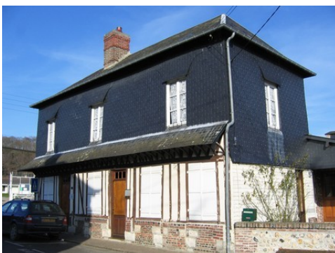
L'essentage en ardoises