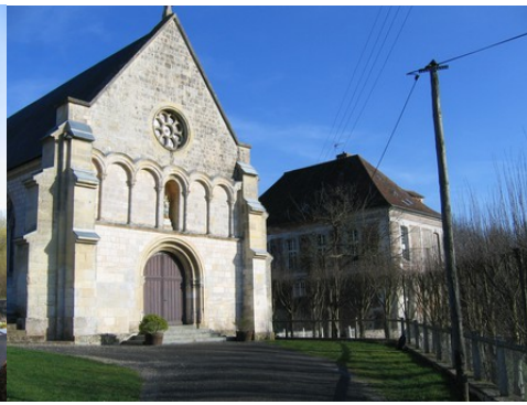
L'église et les bâtiments monastiques