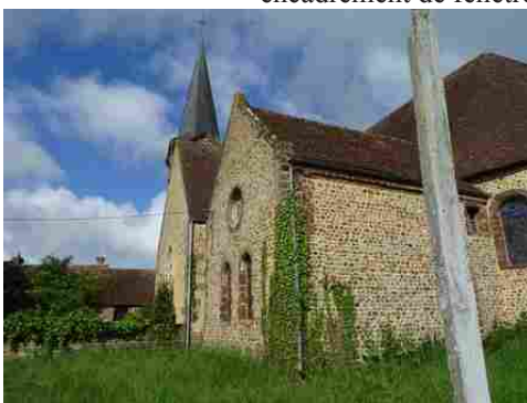
L'église de Chennebrun

Les avis seront cohérents avec ceux émis ces dernières années, à savoir : pas de maisons à volume compliqué (type V, W, Y, ou Z), pentes à 45° pour les volumes principaux, ardoise ou tuile plate de teinte brun vieilli, à 20u/m 2 , avec un débord de toiture de 20cm, enduit de teinte beige clair avec modénatures (au choix : chaînages, encadrement de fenêtres, soubassement, colombage...). *Voir les autres fiches.