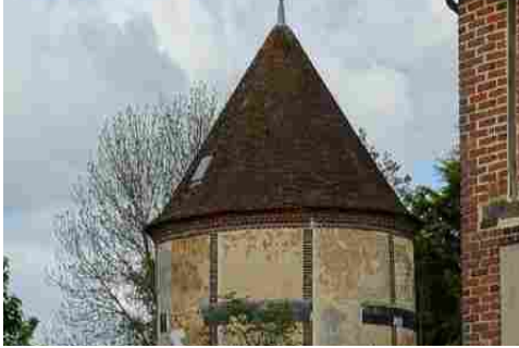
Le colombier circulaire