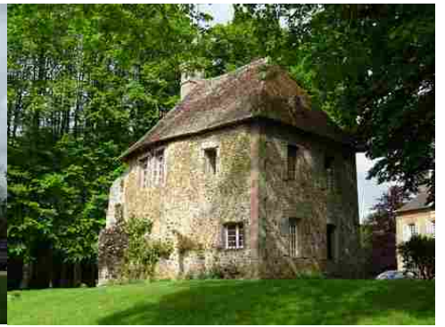
La maison du régisseur