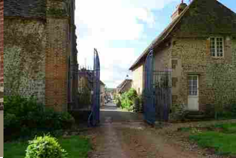
La vue sur la grande rue du village