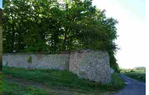
L'enceinte du domaine

Pour la zone en rose foncé dans le périmètre de 500m