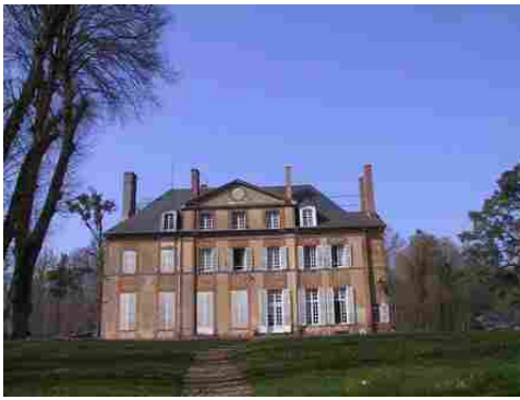
La façade sud du château