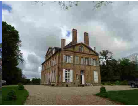
La façade est du château