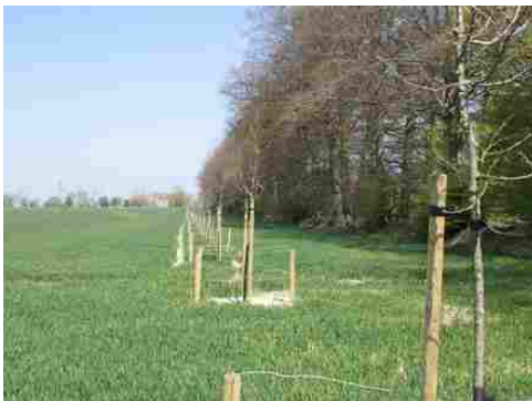
Les champs à la lisière du parc

Les avis seront cohérents avec ceux émis ces dernières années, à savoir : pas de maisons à volume compliqué (type V, W, Y, ou Z), pentes à 45° pour les volumes principaux, ardoise ou tuile plate de teinte brun vieilli, à 20u/m 2 , avec un débord de toiture de 20cm, enduit de teinte beige clair avec modénatures (au choix : chaînages, encadrement de fenêtres, soubassement, colombage...). *Voir les autres fiches.