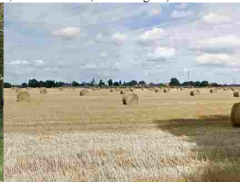
Le vue vers les champs et Etréville