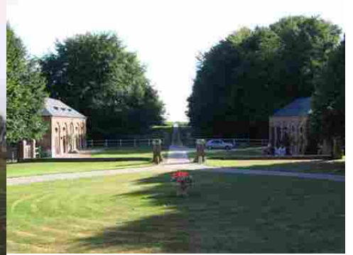
La perspective sud vue depuis le logis

Pour la zone en rose foncé dans le périmètre de 500m