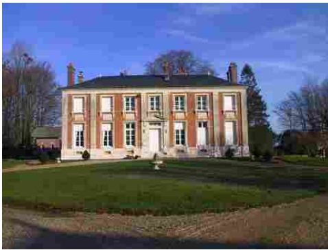
La façade sud du corps de logis