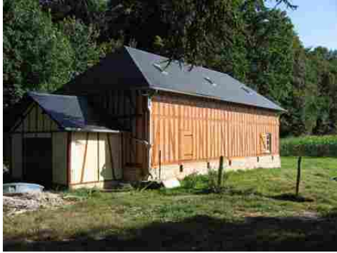
Une annexe récente en colombage