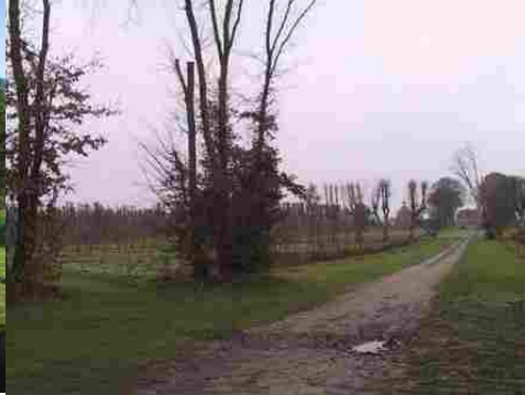
L'allée d'accès au château