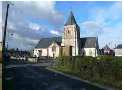
L'église d'Etréville (inscrite MH)