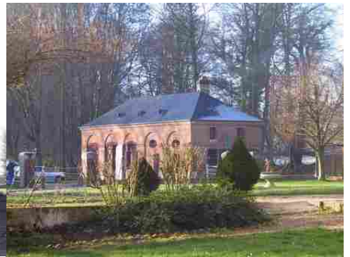
L'aile ouest des communs