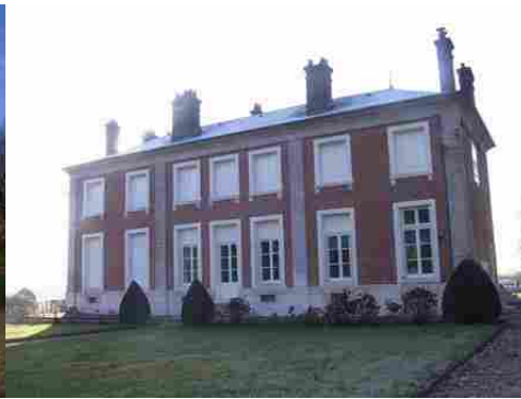
La façade nord du corps de logis