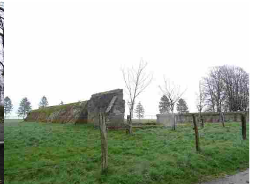
Structure en béton des hangars militaires