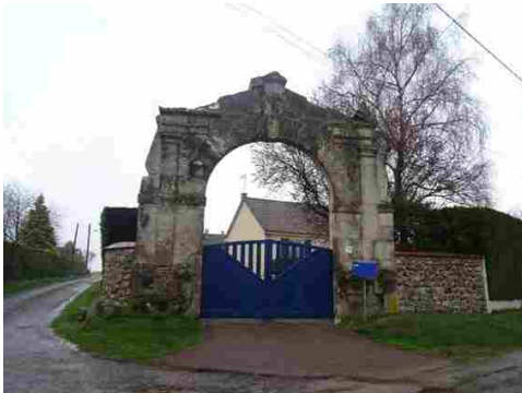
Un portail ancien et un pavillon moderne