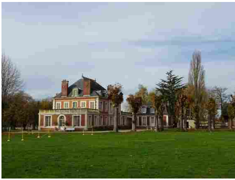
Vue éloignée du château