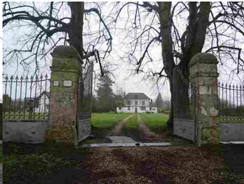
Restes de portails et de domaines anciens