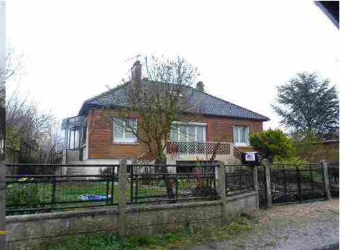
Maison de la Reconstruction