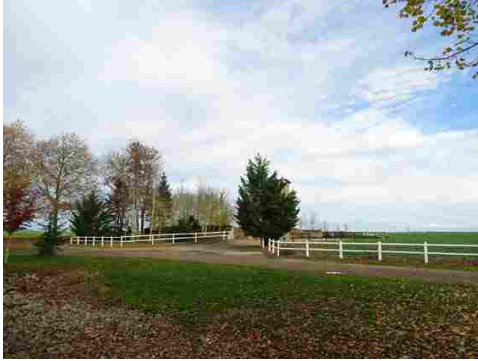
La lisse de clôture vers la plaine