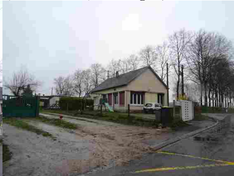
Maison de la Reconstruction