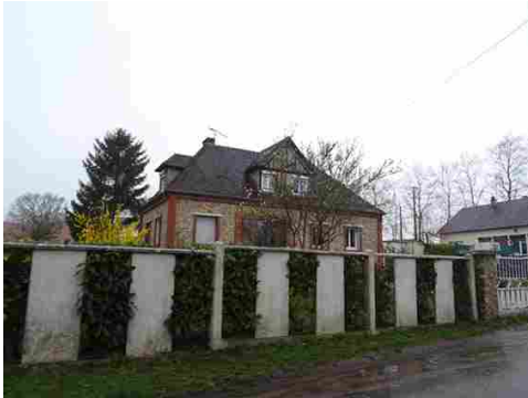
Maison de la Reconstruction

Les avis seront cohérents avec ceux émis ces dernières années, à savoir : pas de maisons à volume compliqué (type V, W, Y, ou Z), pentes à 45° pour les volumes principaux, ardoise ou tuile plate de teinte brun vieilli, à 20u/m 2 , avec un débord de toiture de 20cm, enduit de teinte beige clair avec modénatures (au choix : chaînages, encadrement de fenêtres, soubassement, colombage...). *Voir les autres fiches.