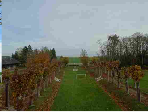
La vue depuis le château vers la plaine