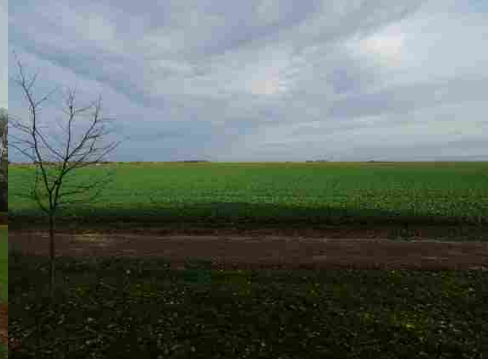
La plaine (ancien aérodrome)

Pour la zone en rose foncé dans le périmètre de 500m