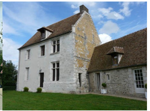
La façade sud du manoir (vue proche) La façade sud du manoir (vue éloignée)