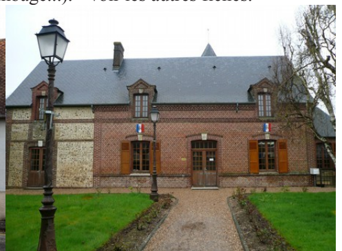
Le monument aux morts et l'église d'Ailly Une chapelle du XIX e siècle en briques La mairie d'Ailly