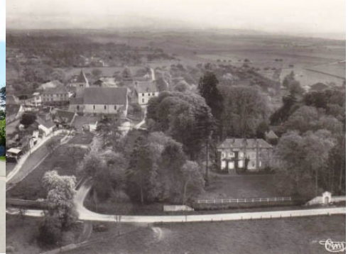
Le manoir vu de la mairie Une vue éloignée de la rue de l'Église

Pour la zone en rose foncé dans le périmètre de 500m