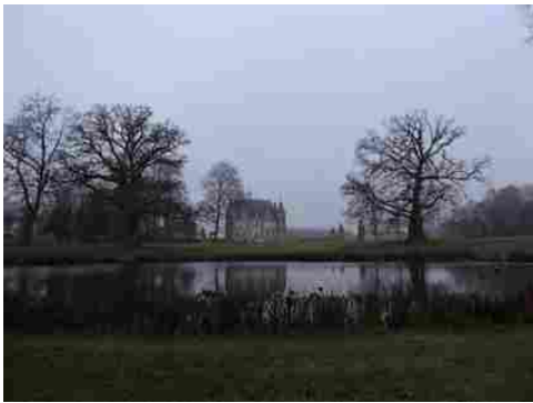
Vue éloignée du château