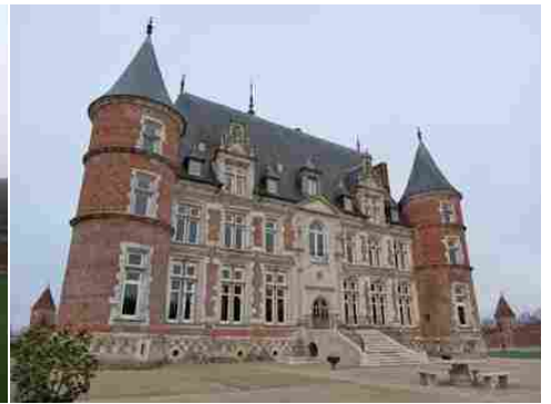
La façade principale