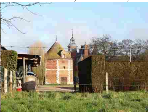
Le colombier de la ferme voisine