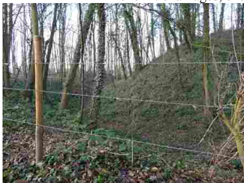
La motte féodale

Les avis seront cohérents avec ceux émis ces dernières années, à savoir : pas de maisons à volume compliqué (type V, W, Y, ou Z), pentes à 45° pour les volumes principaux, ardoise ou tuile plate de teinte brun vieilli, à 20u/m 2 , avec un débord de toiture de 20cm, enduit de teinte beige clair avec modénatures (au choix : chaînages, encadrement de fenêtres, soubassement, colombage...). *Voir les autres fiches.