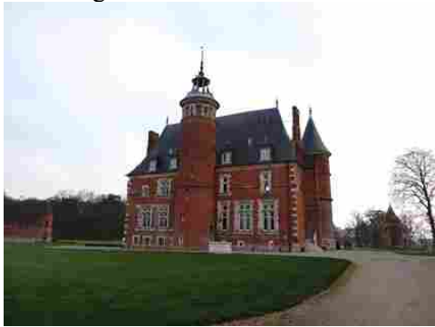
La façade arrière